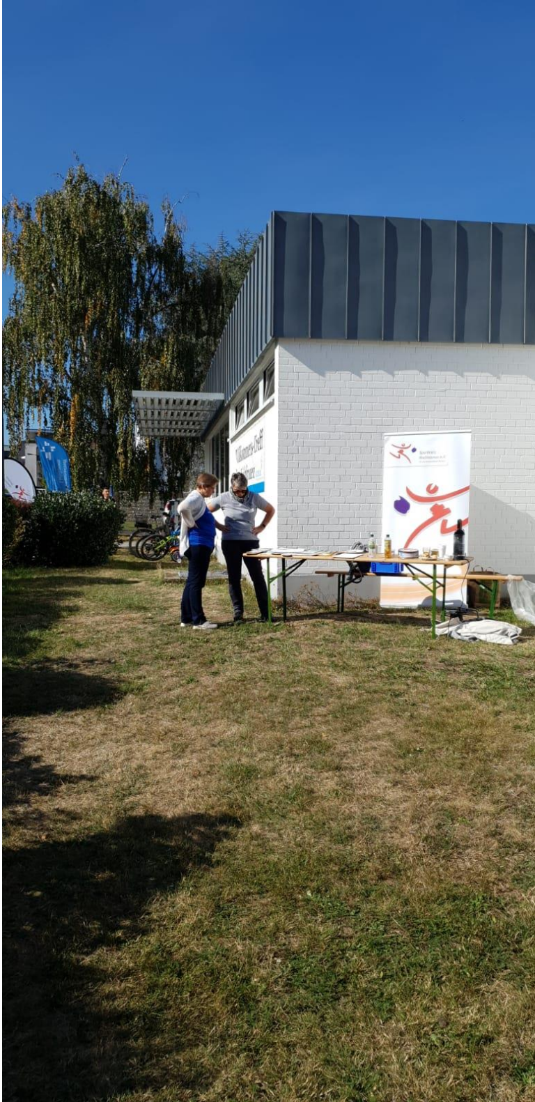
Willkommenstreff in Oberursel